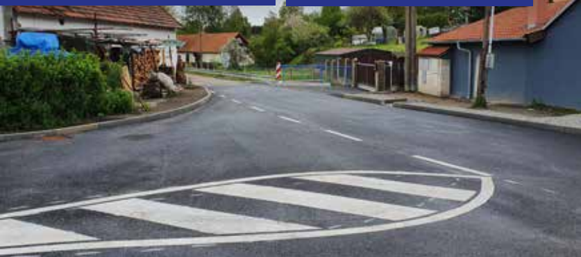
Stavba propustku v Mokrém Lhotě