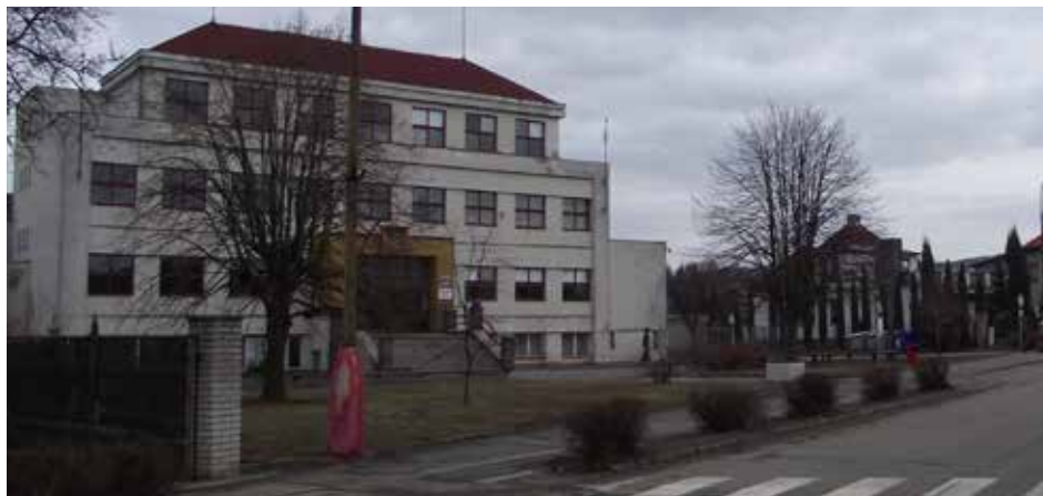
■ Foto: Vchod do základní školy