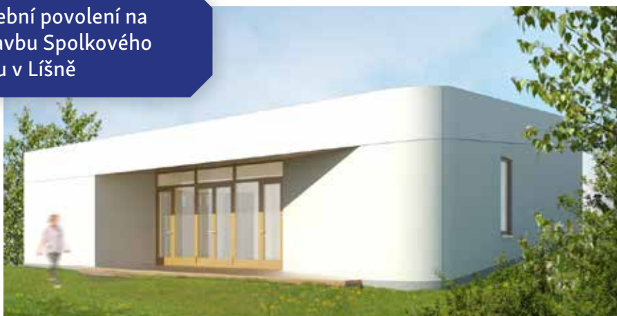
Stavební povolení na výstavbu Spolkového domu v Líšně

Jednotka JSDH Bystřice obdržela novější CAS (cisternovou automobilovou stříkačku) a kompletní sadu WEBER HYDRAULIK pro vyprošťování zraněných účastníků dopravních nehod. Součástí daru od HZS Středočeského kraje byla i elektrocentrála, přetlakový ventilátor a další základní vybavení vozu. Od 1. července 2021 začala bystřická jednotka zasahovat u dopravních nehod.