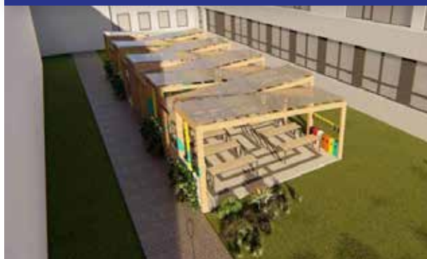
Projektová příprava a stavební povolení na výstavbu venkovních učeben LAB a LOŽ v areálu ZŠ