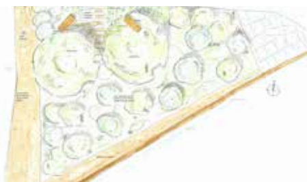
■ Pomník obětem 2. světové války v ulici K Letišti (návrh řešení)