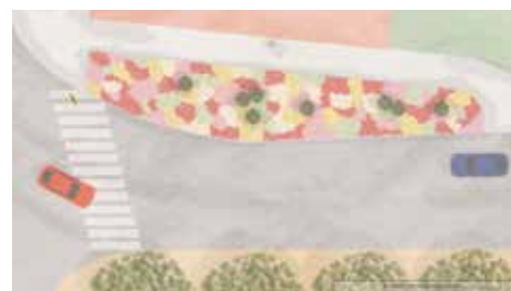
■ Trvalkový záhon v centru města před domem čp. 115