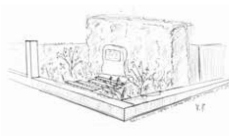
■ Pomník 2. světové války v ulici Dr. E. Beneše