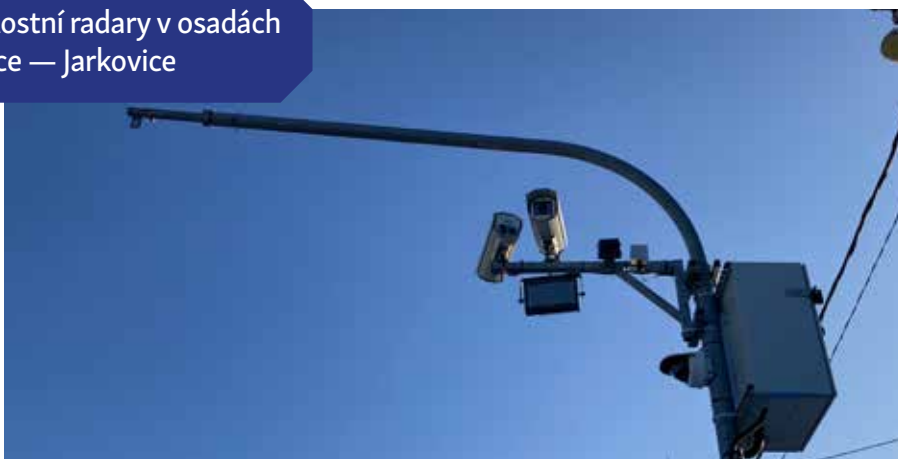
Rychlostní radary v osadách Jírovice — Jarkovice

Multifunkční prostor převážně pro spolkovou činnost bude stát v Líšně nad vagónem. Dům využije pro svou činnost jak osadní výbor a Spolek Líšeňáčků z.s., tak i obyvatelé pro setkávání, tradiční sousedská posezení apod. Návrh počítá se sportovními aktivitami a tancem.