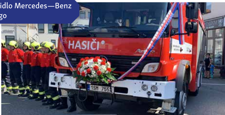
Vozidlo Mercedes—Benz Atego