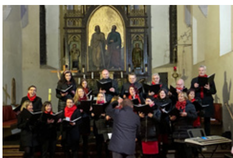
■ Kultura a zákusky v kavárně Kafičko, která je součástí infocentra na Ješutově náměstí.