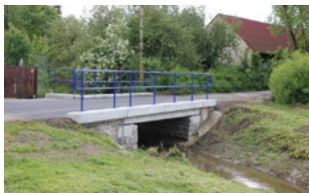
■ Mostek v Drachkově

Dne 31. května byla dokončena stavba nového mostku přes Zahořanský potok v Drachkově. Stavbu prováděla společnost Chládek & Tintěra, a.s. v částce 814 000 Kč. Mostek přes potok se stavěl dva mě-