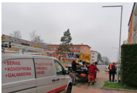
■ V Bystřici probíhá výměna veřejného osvětlení za energeticky úspornější a šetrnější k životnímu prostředí.