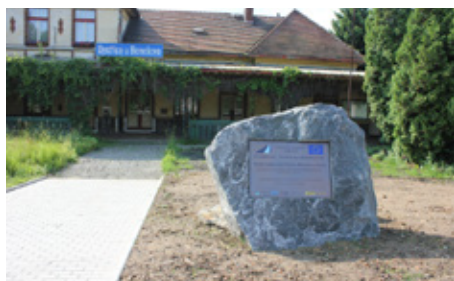
■ Pamětní kámen na nádraží v Bystřici

Po pěti letech stavebního ruchu proběhlo dne 13. června 2013 slavnostní ukončení výstavby IV. železničního koridoru. Během let 2009 až 2013 došlo ke zdvojkolejnění stá-