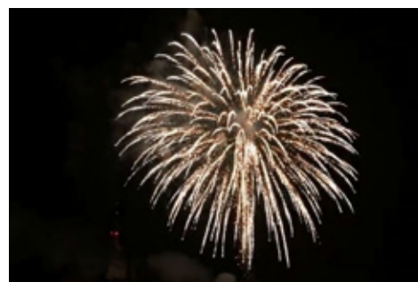
■ Město Bystřice vyzvalo občany k Tichému Silvestru, který je ohleduplnější nejen ke zvířatům.