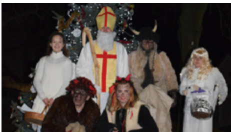
■ Mikuláš, čerti a andělé v Tožici

Letos přišel Mikuláš na tožickou návěs o den dříve, než bývá zvykem, a jako každoročně k již rozsvícenému stromečku. Od půl páté se začaly scházet menší i větší děti v hasičské zbrojnici k vánočnímu tvoření. V 17 hodin zazpíval tožický občasný dětský smíšený sbor – pod vedením čerstvě dospělého sbormistra a s doprovodem ostatních dětí – několik vánočních koled. Poté