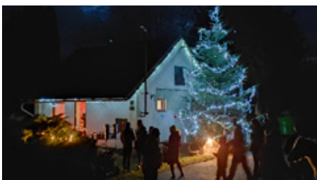
■ Rozsvícení vánočního stromu na návěsi

Text a foto: Irena Gavroňová, členka Osadního výboru Tvoršovice