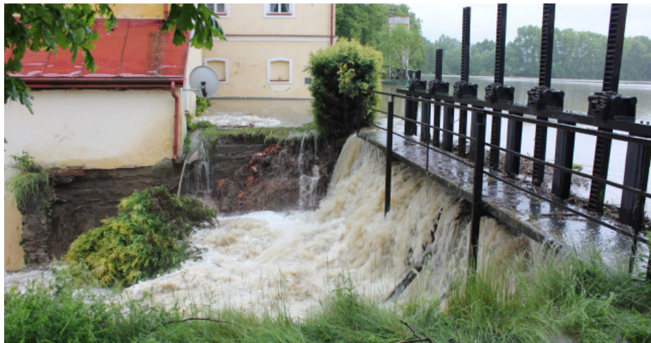
■ Povodně u splavu Splavského rybníka

Zatímco v sobotu 27. dubna zasáhla lokální záplava osady Ouběnice, Jířín, Jeleneč