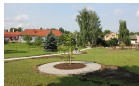
■ Náves v Nesvačilech

Koncem měsíce června byla dokončena úprava návsi a odbahnění návesného rybníka v Nesvačilech. Odbahnění rybníka