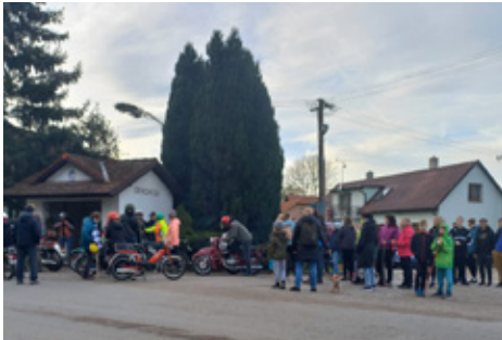
■ Silvestrovský pochod v Drachkově