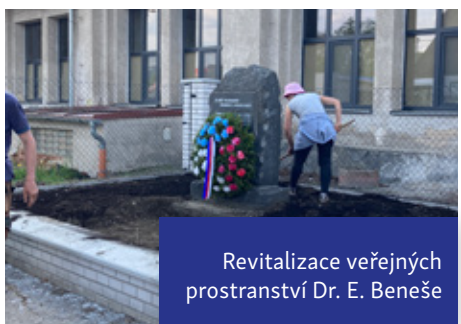
Revitalizace veřejných prostranství Dr. E. Beneše

Prostor, který bude sloužit jako příjemné místo pro setkávání občanů a pořádání kulturních a společenských akcí.