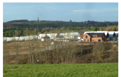
■ Tvoršovice | Druhá etapa výstavby nového sídliště pokračuje. V současné době probíhají dokončovací práce na 25 domcích stavěných v této etapě.