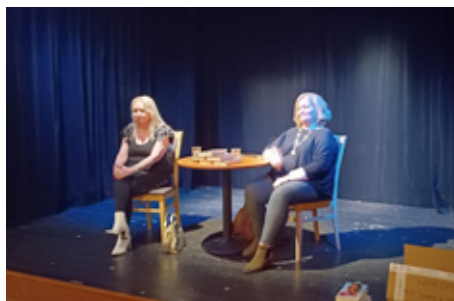
■ Foto: Setkání s oblíbenými autorkami proběhlo v Divadle U Jelena