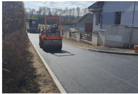
■ Jírovice | Pokládka nového asfaltu. Další místo se dočkalo vylepšení svého povrchu.