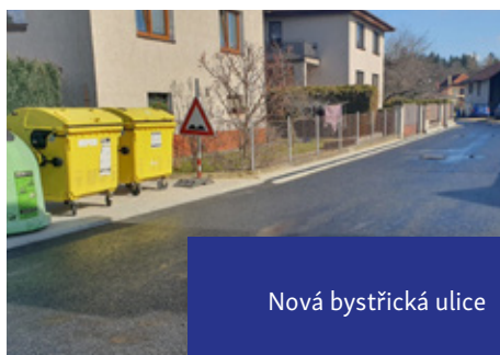
Nová bystřická ulice

Po kompletní opravě místní komunikace v obci Bystřice vznikla nová ulice s názvem Rybízová.