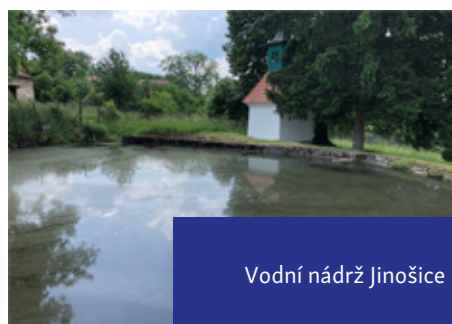
Vodní nádrž Jinošice

Dokumentace řeší zvýšení bezpečnosti dopravy s jasným vymezením prostoru pro jednotlivé účastníky provozu.