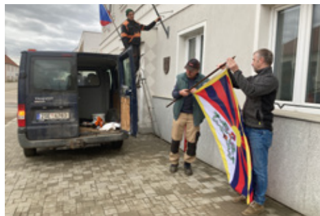
■ Radnice vyvěsila 10. března tibetskou vlajku. Poukázala tak na porušování lidských práv v Tibetu.