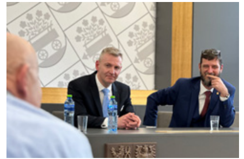
■ Setkání se senátorem Zdeňkem Hrabou v zasedací síni Městského úřadu Bystřice.