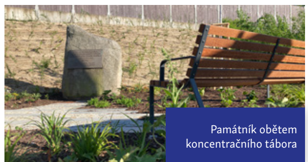
Památník obětem koncentračního tábora

Cílem projektu bylo vytvoření důstojného a esteticky přívětivého místa odpovídajícího odkazu tragické události. Nový chodníček z kombinace betonových šlapáků a žulové dlažby umožní pohodlný přístup k památníku a zároveň slouží ke kladením věnců. Pozadí pomníku tvoří živý plot.