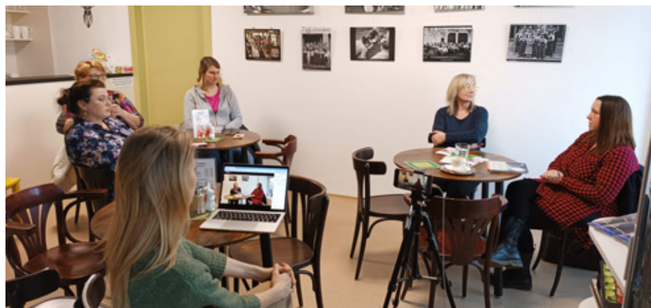
■ Foto: Čtení z deníku se přenášelo živě pro diváky, kteří se připojili on-line