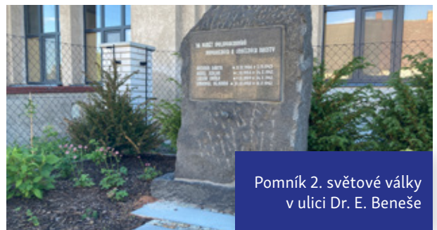
Pomník 2. světové války v ulici Dr. E. Beneše

V centru města Bystřice, u staré školy, byl nově vysazen trvalkový záhon. Byly usazeny nové obrubníky, instalovány dřevěné sloupky s provlečeným lanem a provedena výsadba suchomilných a světlo milných rostlin s růžovo-bílo-fialovým zbarvením květů.