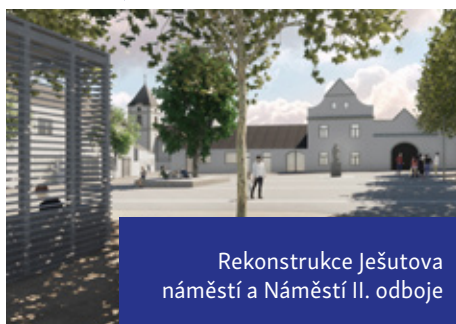
Rekonstrukce Ješutova náměstí a Náměstí II. odboje

Prostor, který bude sloužit jako příjemné místo pro setkávání občanů a pořádání kulturních a společenských akcí.