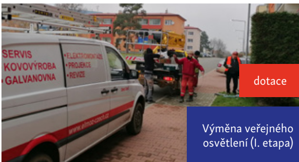
Výměna veřejného osvětlení (I. etapa)

Na předchozí podkrovní vestavbu 2 bytových jednotek navázala kompletní rekonstrukce zbývajících 3 bytových jednotek a nyní je dům č. p. 99 v ulici Syllabova připraven na budoucí nájemníky. Každý byt je vybaven kuchyňskou linkou včetně spotřebičů a dalšími truhlářskými prvky.