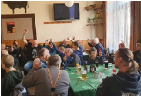
■ Na valné hromadě Honebního společenstva Bystřice bylo mimo jiné zvoleno nové vedení.