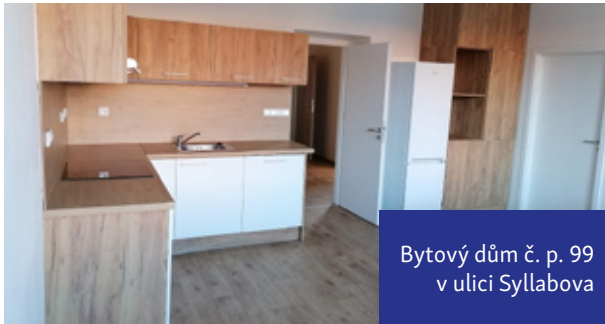
Bytový dům č. p. 99 v ulici Syllabova

Na předchozí podkrovní vestavbu 2 bytových jednotek navázala kompletní rekonstrukce zbývajících 3 bytových jednotek a nyní je dům č. p. 99 v ulici Syllabova připraven na budoucí nájemníky. Každý byt je vybaven kuchyňskou linkou včetně spotřebičů a dalšími truhlářskými prvky.