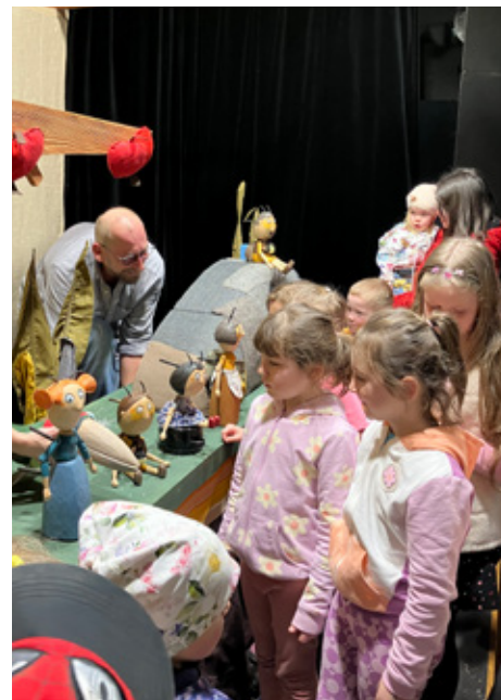
■ Foto: Děti měly loutky na dosah ruky a mohly si je prohlédnout zblízka.

diváků. Velký, malý hrdina zažívá největší dobrodružství svého života. Má už lucerňičku, a tak se vydává poznávat svět.