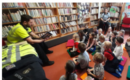
■ Foto: Čtení Policejních pohádek