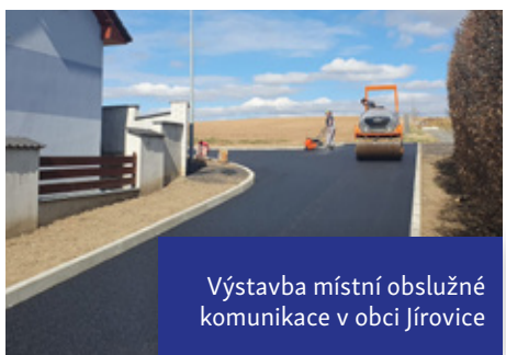
Výstavba místní obslužné komunikace v obci Jírovice

Po kompletní opravě místní komunikace v obci Bystřice vznikla nová ulice s názvem Rybízová.