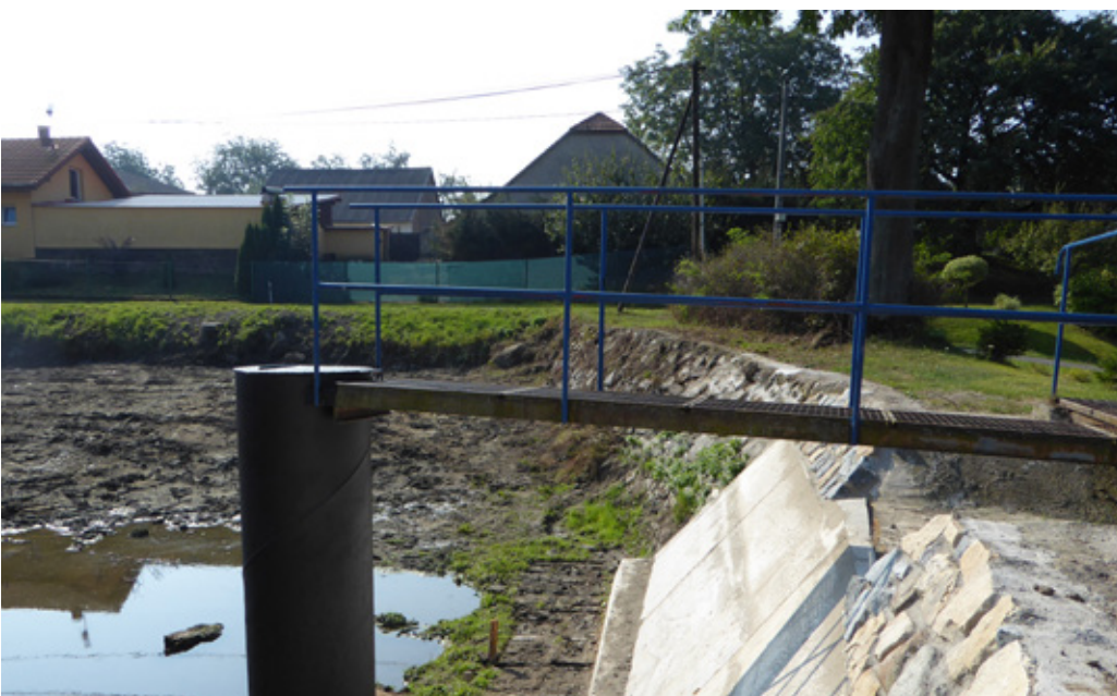
■ Foto: Vodní nádrž v Božkovcích

Koncem listopadu byl v Bystřici proveden monitoring vodovodní sítě, v rámci něhož byly na vybrané hydranty osazeny tlakové snímače a provedeny hydrantové testy. Na základě naměřených dat byl kalibrován matematický model vodovodní sítě Bystřice. Kromě základních údajů, odrážejících stávající stav, bylo formulováno několik výhledových zátěžových stavů počítajících s nárůstem počtu obyvatel a nárůstem spotřeby vody. Na základě těchto měření a výpočtů byl začátkem roku 2017 předložen zastupitelům k projednání dokument s názvem Hydraulické posouzení vodovodní sítě města Bystřice. ■