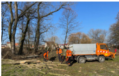
Foto: Pořez dřeva u potoka Bystrý

V období března a dubna pracovníci služeb pracovali zejména na prořezech a kácení náletových dřevin a stromů. Současně s tím byl vykácen prostor pro vznik nového parku vedle mostu v Bystřici přes potok Bystrý.