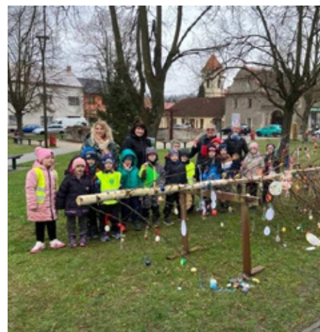
■ Foto: Děti ze školky u nazdobené břízy

Ve čtvrtek 30. března se na Ješutově náměstí zdobila velikonoční bříza. Vajíčka na břízu vyrobily děti z mateřské a základní školy. Holky a kluci ze školky nám ji pomohli i nazdobit společně s bystřičkými maminkami a jejich dětmi. Děkujeme všem, co se zapojili do výroby a sběru vajíček a zdobení břízy. ■