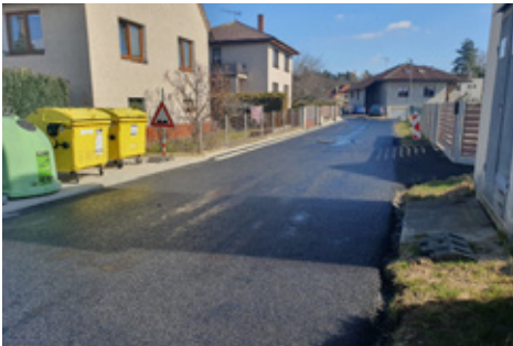
■ V ulici Rybízová byla položena spojovací vrstva (viz. foto) a vrchní obrusná vrstva asfaltu.