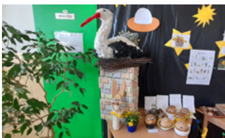
■ Foto: Výzdoba vítající jaro

Čas plyne rychle, zápis do 1. třídy se blíží a děti hrou poznávají, co je čeká u zápisu. Znájí svoje celé jméno? Umí se správně obléci a mnoho dalších dovedností? Snaží se pilně a už teď ví, že „Bez práce nejsou koláče“.