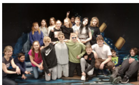
■ Foto: Třída 7. A na výletě v Praze