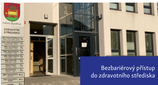
Bezbariérový přístup do zdravotního střediska

Díky dotaci určené na rekonstrukci a inovaci soustav veřejného osvětlení za účelem dosažení úspory elektrické energie mohla být zahájena I. etapa, ve které dochází k výměně celkem 331 ks nových svítidel v Bystřici a v Mokré Lhotě. Tento projekt je spolufinancován z dotace.