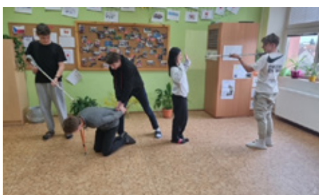
■ Foto: Žáci při hodině dějepisu

Ke konci března se třída 7. A vydala na výlet do Prahy. V dopoledních hodinách jsme zavítali do Muzea fantastických iluzí. Stali jsme se součástí optických klamů a velkoformátových trikových obrazů. Vyzkoušeli jsme kouzelnou židli nebo magickou místnost, která nás proměnila v trpaslíka nebo obra. Prošli jsme se hlavou dolů po stropě místnosti, stali se primabalerínou, nechali se uvěznit ve středověké laboratoři. Dozvěděli jsme se za-