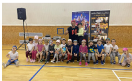
■ Foto: Taneční program Doctor Dancer