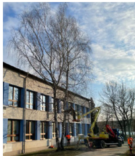
Foto: Prořez u základní školy

V následujícím období budou pracovníci služeb zajišťovat běžné komunální činnosti, které se budou odvíjet od aktuálního počasí. Dle zkušeností budeme od poloviny dubna již začínat sečení a práce s vertikutátorem. Bude probíhat pravidelný svoz odpadů a bude dokončeno kontejnerové stání včetně přístřešku u základní školy.