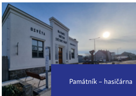
Památník – hasičárna

Obnova fasády navrátila původní krásu budově památníku, který je rovněž využíván jako hasičská zbrojnice.