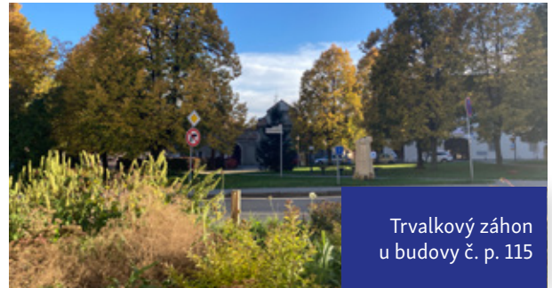
Trvalkový záhon u budovy č. p. 115

V centru města Bystřice, u staré školy, byl nově vysazen trvalkový záhon. Byly usazeny nové obrubníky, instalovány dřevěné sloupky s provlečeným lanem a provedena výsadba suchomilných a světlo milných rostlin s růžovo-bílo-fialovým zbarvením květů.