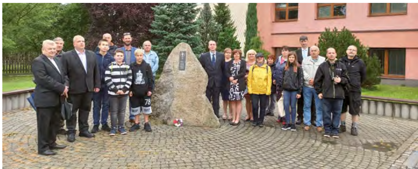
▲ Deska, připomínající upálení devíti husitů v Bystřici 7. července 1420, byla 1. září odhalena před základní školou v Bystřici. Iniciátorem bylo Sdružení Bojovníci boží – 600 let, desku navrhnul ak. arch. Tomáš Kotas