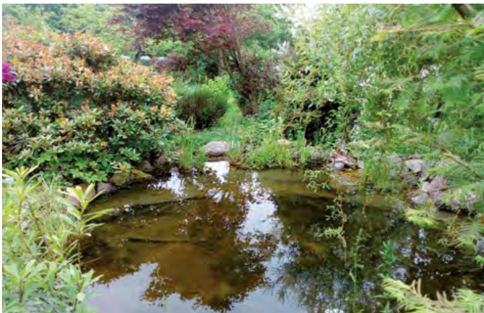
▲ Jezírko Oty Ježka je rájem obojživelníků

Výsledky soutěže budou zveřejněny v prosincovém vydání Hlasu Bystřice. Autoři tří vítězných fotografií obdrží ceny, věnované městem Bystřice – poukázky na zahrádkářské potřeby v hodnotě 1500, 1000 a 500 Kč.