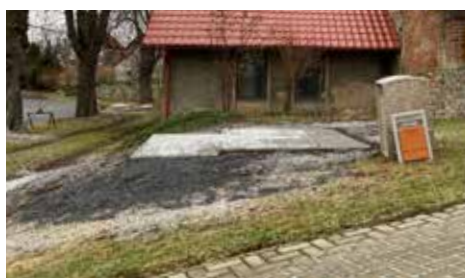
Autobusová zastávka v Jinošicích