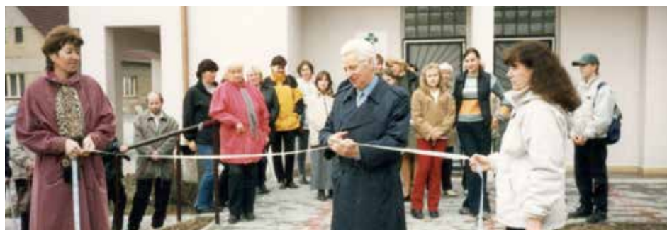
■ Foto: Slavnostní otevření domu s pečovatelskou službou

V období od 6. do 15. srpna zasáhla Českou republiku hrozivá povodeň. Neštěstí se naštěstí města Bystřice přímo nedotklo. Preventivně však byla uskutečněna některá protipovodňová opatření. Na potoce Bystrý byl odstraněn nános bahna nad mostem, byl pročištěn Lístěnecký potok, v Drachkově bylo zabráněno odtoku přívalových vod