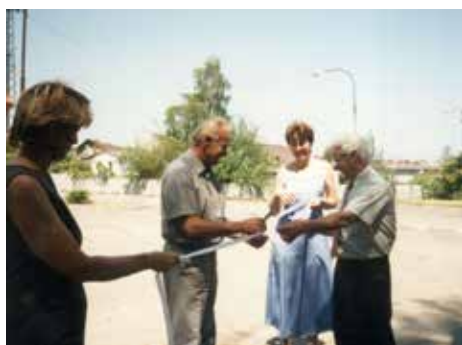
■ Foto: Slavnostní otevření čistírny odpadních vod

Slavnostní zakončení stavby kanalizace, čističky odpadních vod a vodovodu v Bystřici se konalo dne 20. června 2002. Akce se účastnili i zástupci Ministerstva životního prostředí, Ministerstva financí, Státního fondu životního prostředí, Okresního úřadu Benešov, projektových a dodavatelských