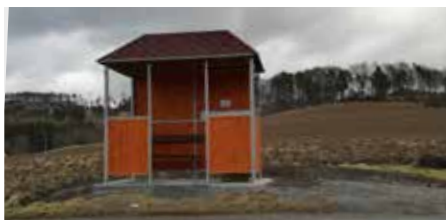
Autobusová čekárna v Hutích