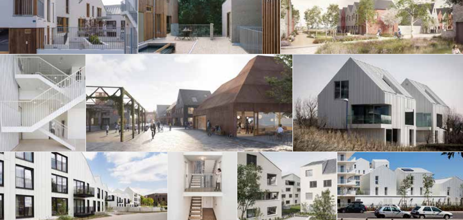
■ Obrázek výše: Vizualizace vila domů s obchody na návsi, výhledový stav další etapy výstavby.

cipován jako uzavřený s liniově vystavenými řadovými domy s bariérovými ploty, ale aby naopak bylo cílem umožnit využití rekreačních ploch a nově vzniklých služeb také pro stávající občany Tvoršovic či Bystřice. Což nebylo původním záměrem investora, který chtěl mít lokalitu jako uzavřenou rezidenci bez možnosti využití ploch pro veřejnost.