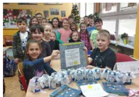
■ Aktivity a programy v základní a mateřské škole.