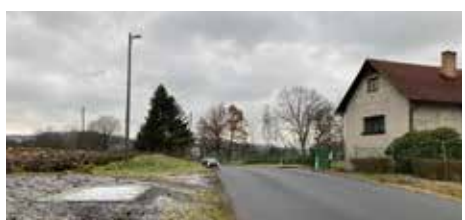
Autobusová zastávka v Hutích