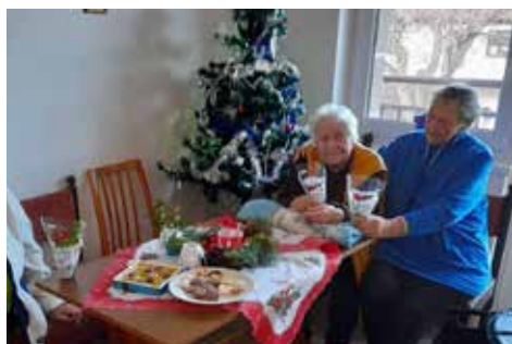
■ Děti se zapojily do veřejné výzvy a vyrobily přání, které potěšilo seniory v Bystřici a ve Vojkově.