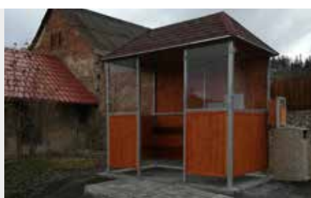
Autobusová čekárna v Jinošicích