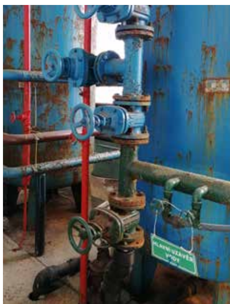
■ Stará úpravná vody

Projekt s rozpočtem přibližně 3,6 mil. je z 80 % spolufinancován Státním fondem životního prostředí ČR. 🟩