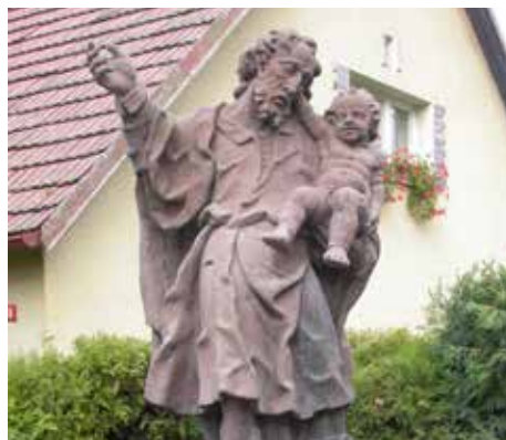
■ Obrázek: Sousoší sv. Josefa