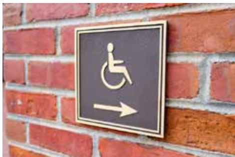
■ Dne 1. 6. došlo k předání stavby výtahu u střediska. Po kolaudaci bude možné ho plně využívat.