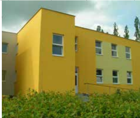
■ Obrázek: Přístavba mateřské školy

Kolaudace přístavby mateřské školy v Bystřici proběhla koncem měsíce května. Celá akce vyšla město na 11 600 000,- Kč. Velkou část ceny uhradilo město, přes milion korun bylo získáno dotací od Ministerstva financí ČR. Přístavba zahrnuje dvě nové třídy s kompletním vybavením pro cca 56 nových dětí. Jednalo se o patrovou stavbu, která vytvořila s bývalou budovou jednotný celek. Obě části jsou propojeny chodbou v úrovni přízemí i prvního patra. V obou patrech se nachází chodba, přípravná jídelna, jídelna, úložna lehátek, šatna, herna, umývárna a úklidová komora. Vytápění bylo napojeno na stávající rozvody hlavní budovy.