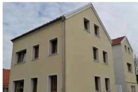
■ Stavební úpravy a rekonstrukce bytových jednotek č.p. 99 se chýlí ke konci.