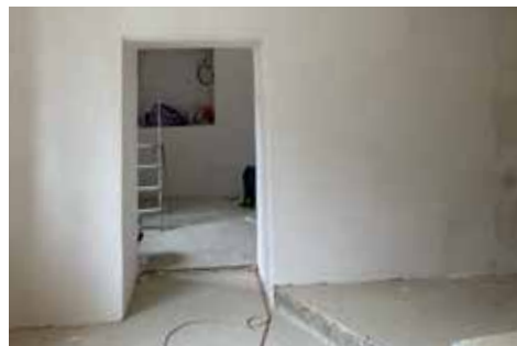
■ Přestavba prostorů v budově U Jelena na infocentrum je v plném proudu. V novém infocentru budete mít možnost posedět a dát si dobrou kávu.