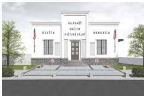
■ Můžete se těšit na rekonstrukci památníku u hasičárny. Projekt má navrátit objektu jeho důstojnost.