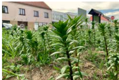
■ Liliová louka na Ješutově náměstí v květnu 2022 (foto vlevo) a v červnu 2022 (foto uprostřed a vpravo).