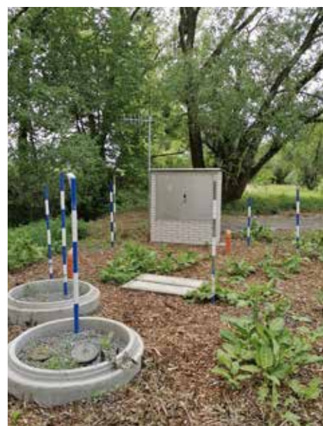
■ Nesvačily – napojení vodovodu