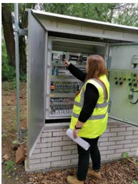
■ Technologie umožní přenos dat na centrální dispečink provozovatele